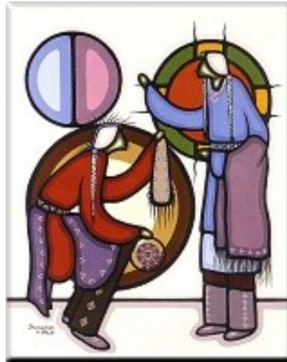
Leland Bell / Bebaminojmat

teveel in de klassieke West-Europese traditie. Toch staan de trouwringen , juist door hun universele karakter, de eenvoudige symboliek die uit hun basale ronde vormen spreekt, heel dicht bij het kosmologische geloof van de Native voorouders van de goudsmid. Deze leefden met het diep gevoelde besef dat alles in de natuur - dus ook de liefde tussen twee mensen - wordt beheerst door cyclische machten.