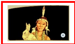
Zhaawananang , beschermgeest uit het Zuiden, brengt vruchtbaarheid, voeding en warmte en leert de mensen verstandig en begripvol te zijn.