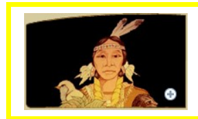
Waabananang , beschermgeest uit het Oosten, brengt met iedere nieuwe dag heling, geboorte en hergeboorte.