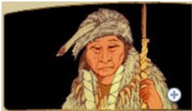
Giiwedinanang (Polaris) beschermgeest van het Noorden, brengt de winter, ziekte en ouderdom.

Hier symboliseert de rode kleur van de trouwringen de warmte die uit de zuidelijke richting komt. Het zuiden, de richting waar de vruchtbaarheid en regen brengende dondervogels leven, wordt van oudsher beschouwd als een aadizokaan (Grootvader) die de natuur groei brengt en de mensen leert begripvol te zijn.