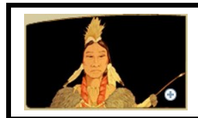
Ningaabi-anang , beschermgeest uit het Westen, brengt de mensen wijsheid en geestelijke rijping.