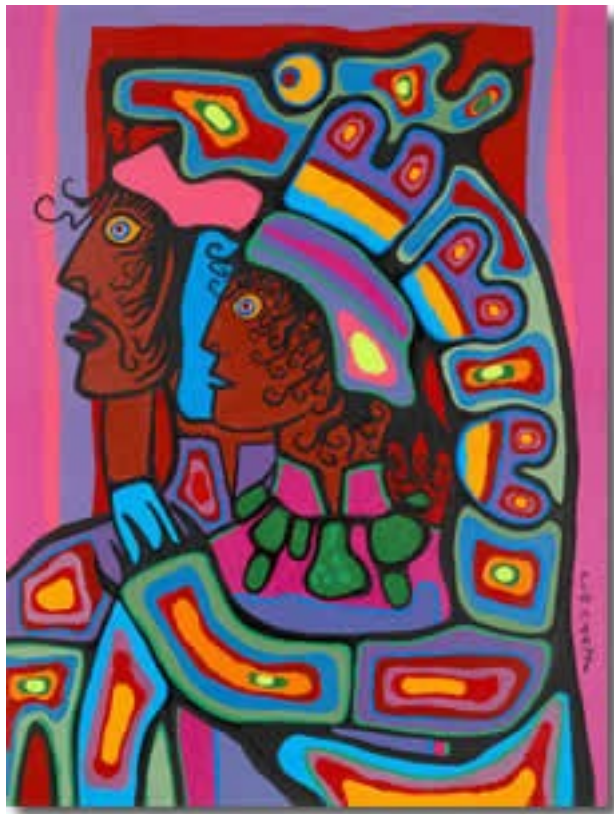
Kunstenaar :Norval Morrisseau/ Miskwaabik Animikii: "The Wedding".

De Midewiwin oftewel het Grote Medicijnhuis, dat uit helers, ethici en filosofen bestaat en sinds mensenheugenis een centrale rol speelt in de samenlevingen van alle Anishinaabe-sprekende volkeren, verbindt van oudsher de heilige kleuren zwart, wit, groen (of lichtblauw) en rood aan de vier windrichtingen van het universum. Zwart is het noorden; wit is het oosten; groen of lichtblauw is het zuiden; rood is het westen.