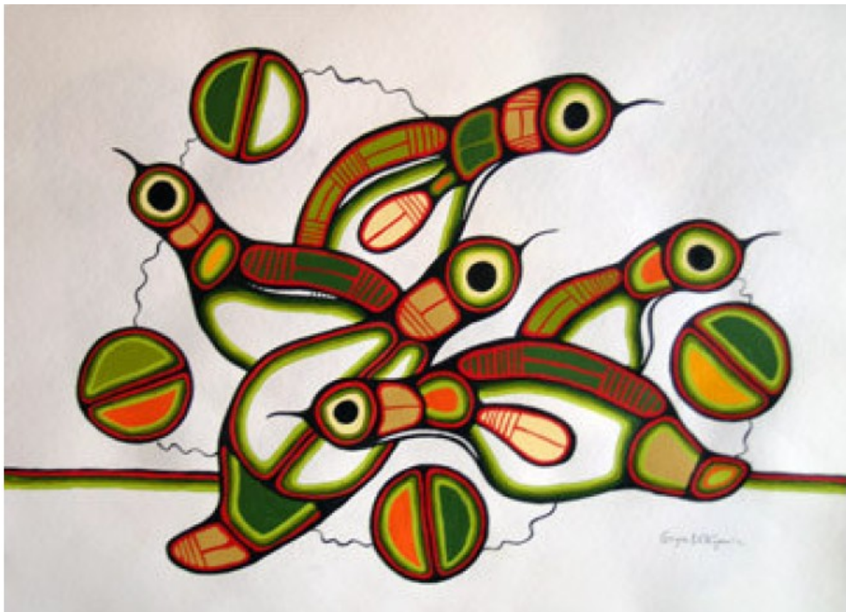
"Family of loons" door Goyce Kakegamic

Deze witgouden handgesmede trouwringen – die zowel glanzend en gematteerd, als ook met én zonder edelsteen kunnen worden uitgevoerd – hebben door hun strakke uitvoering een moderne, exclusieve uitstraling. Dit effect wordt nog versterkt door de toevoeging van de vierkante, carrégeslepen smaragden; deze zijn op ongebruikelijke wijze – want enigszins verhoogd in de ringscheen – gezet in geelgoud. In de herenring – die hier is uitgevoerd met een gematteerde buitenzijde en een hoogglanzende binnenzijde – kan op verzoek eveneens een smaragd geplaatst worden.