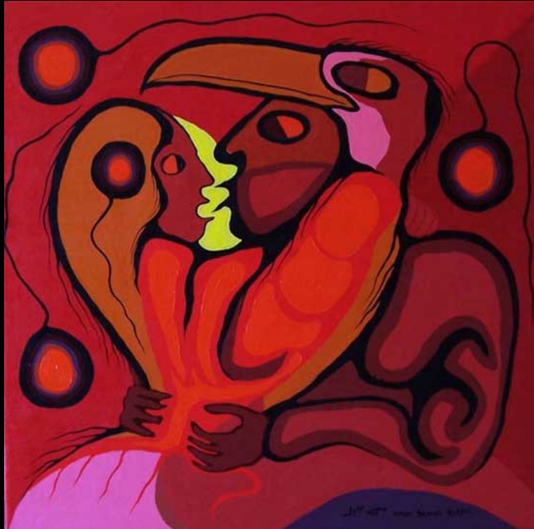
One Body One Spirit by Amik (Moses Beaver)