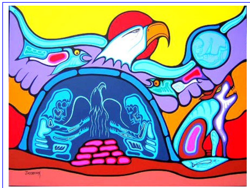
Ceremony: Healing the Innocent Child by Mark Anthony Jacobson

“Native” spiritualiteit heeft, in tegenstelling tot de grote wereldreligies, een wezenlijk individueel karakter. Zo vindt van oudsher een Anishinaabe-persoon invulling en bescherming gedurende zijn leven, door het volgen van de Nishinaabe Aadiziwin-Miikana , de Goede Weg, met behulp van de heilige liederen en medicinale formules van de Midewewin , het eeuwenoude filosofisch/religieuze medicijngeenootschap van zijn volk. Persoonlijke objecten zoals amuletten en medicijnbuidels kunnen een rol spelen, of dromen, of het zoeken naar speciale spirituele krachten oproepende visioenen.