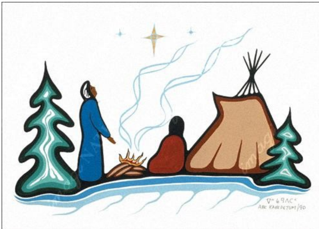
Painting by Abe Kakepetum