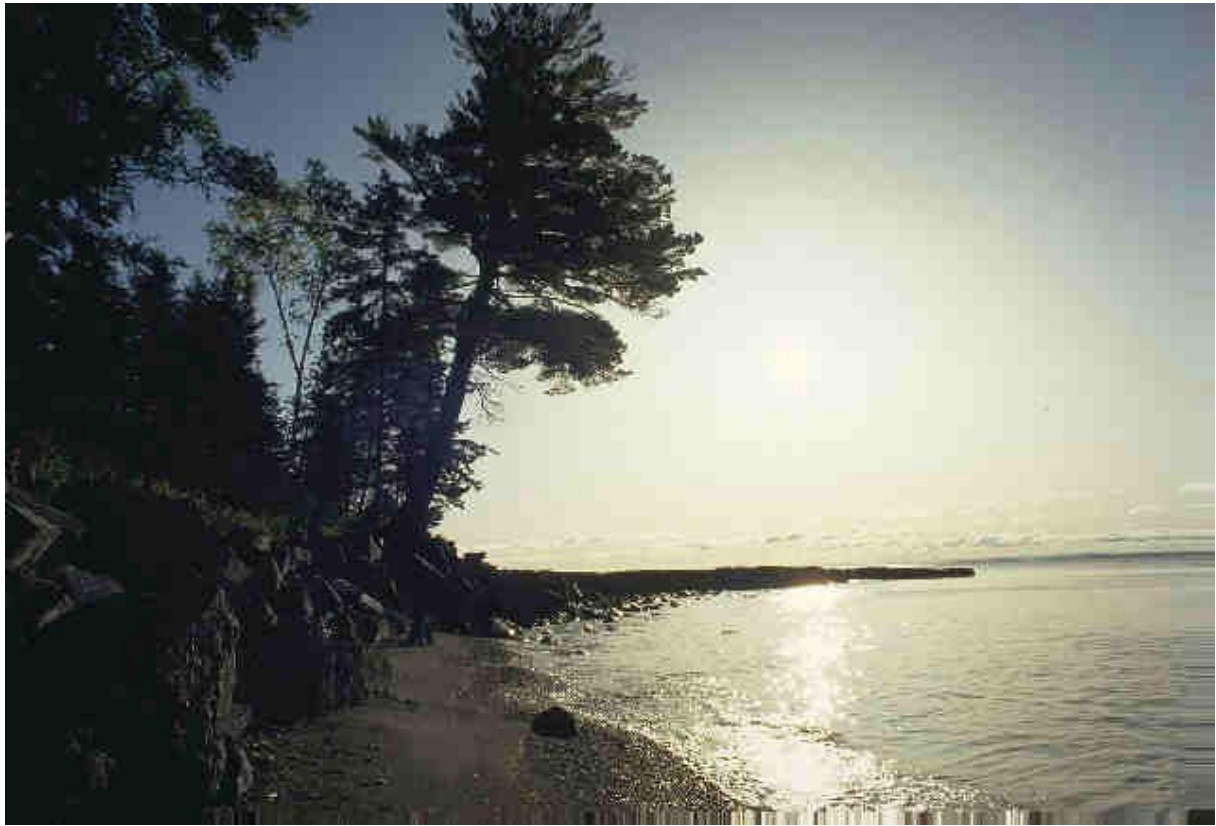
Photo: Lake Superior

Aan de achterziden van de trouwringen zijn de gestileerde, met roodgoud ingelegde afbeeldingen van twee `loons` oftewel Canadese ijsduikers geplaatst. De Anishinaabeg, die van oudsher dol zijn op deze eigenwijze watervogel met zijn parelmoeren verenkleed, beschouwen de loon als symbool van huwelijkstrouw. En wie goed luistert hoort bij het vallen van de avond hun melancholiek stemmende kreet galmen over het wateroppervlak van Gichi-Ojibwe-Gamiing , het grote Bovenmeer...