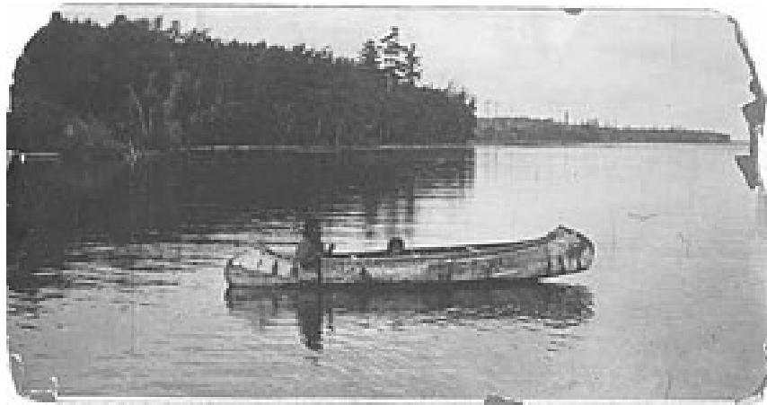
Red Lake Minnesota, circa 1899

Het sterk gestileerde, minimalistische design van deze witgouden overlay-trouwringen , die de naam baswewe, aazhawaadjigade gichi-gamiing giweedid (letterlijk: stem die over het grote noordelijke meer galmt) dragen, ademt het subarctische karakter van het Noord-Amerikaanse Grote-Merengebied. Maar bovenal reflecteert het de ziel en het wereldbeeld van de Ojibwe-Anishinaabeg , wier semi-nomadische cultuur sinds mensenheugenis een onlosmakelijk deel van dit bos- en waterrijke gebied vormt.