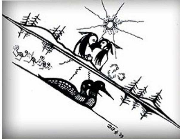
'Lake Romance' by Zhaawano Giizhik