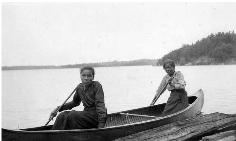
Rainy Lake, 1914