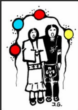
Pentekening door Zhaawano

Maar in de meest specifieke zin verwijst de symboliek in deze trouwringen naar het Anishinaabe -concept van wiidigendiwin , het huwelijk, de meest heilige verbintenis tussen levenspartners.