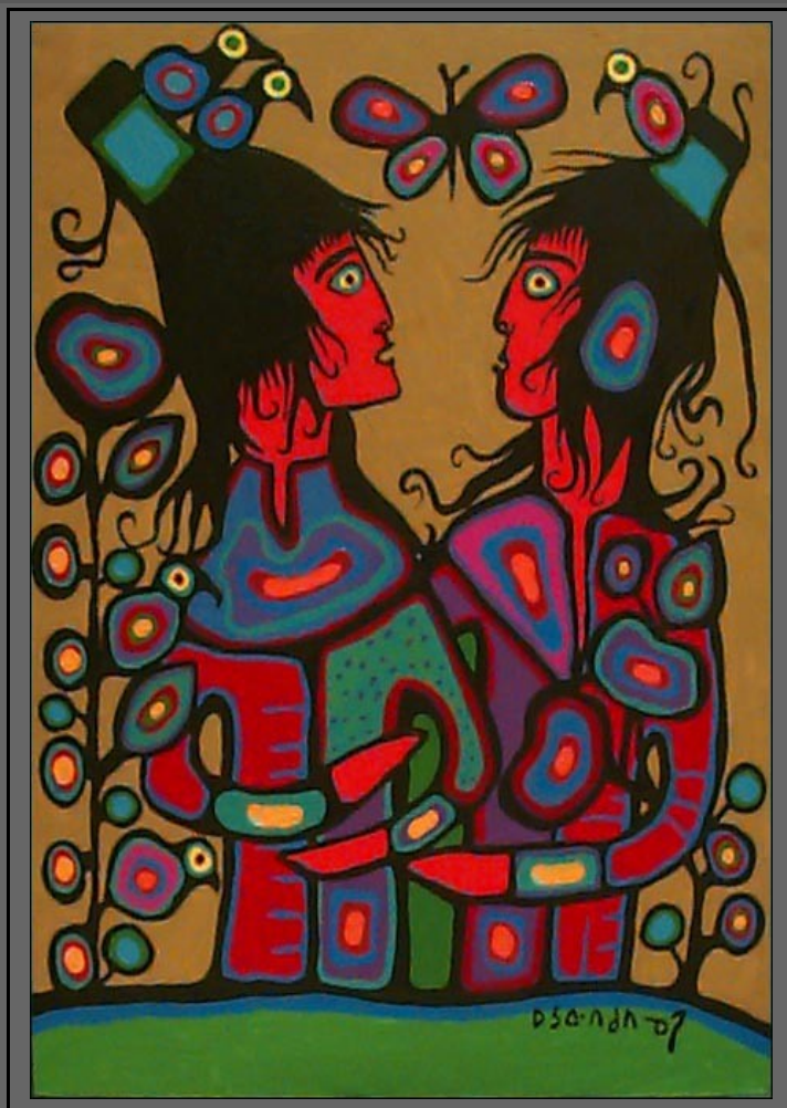
Een huwelijkspechtigheid geschilderd door Norval Morrisseau/ Miskwaabi Animiiki (Ojibwe)