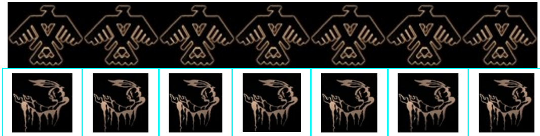
Zevenluik ' honoring the thunder-grandfathers and praying for strong medicine' © Unieke Trouwringen.nl