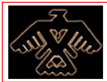
Traditional Ojibwe thunderbird design

Over een juiste prijs van een trouwringmodel kunt u zich desgewenst telefonisch, per fax, per e-mail of d.m.v. het contactformulier altijd nader laten informeren.