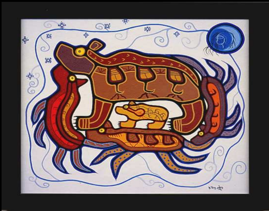
Roy Thomas: Spirit of the North wind