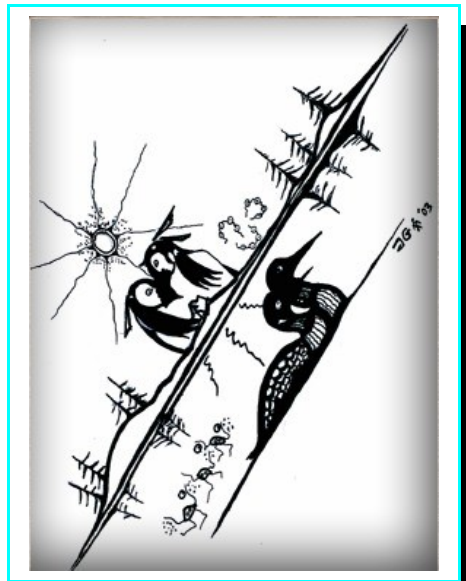
"Lake Romance", drawing by Zhaawano Giizhik © Unieke Trouwringen

Over een juiste prijs van een trouwringmodel kunt u zich desgewenst telefonisch, per fax, per e-mail of d.m.v. het contactformulier altijd nader laten informeren.