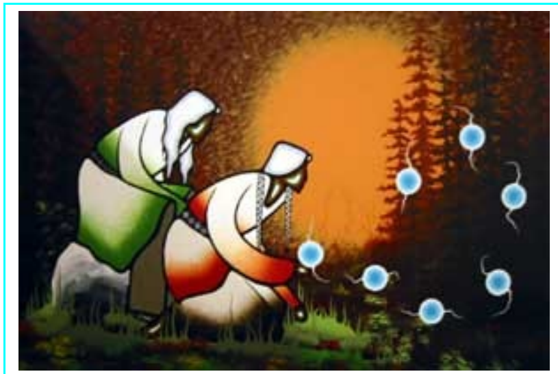
Painting by Ojibwe Medicine Painter Leland Bell, showing Spirit Suns 'floating' in nature

De naam van deze trouwringen is manidoo-giizisoog , hetgeen Anishinaabe is voor 'spirit suns'. De ringen zijn voorzien van meerdere goudkleuren, hetgeen ze een verrassend subtiel contrast en een 'warme' uitstraling verleent.