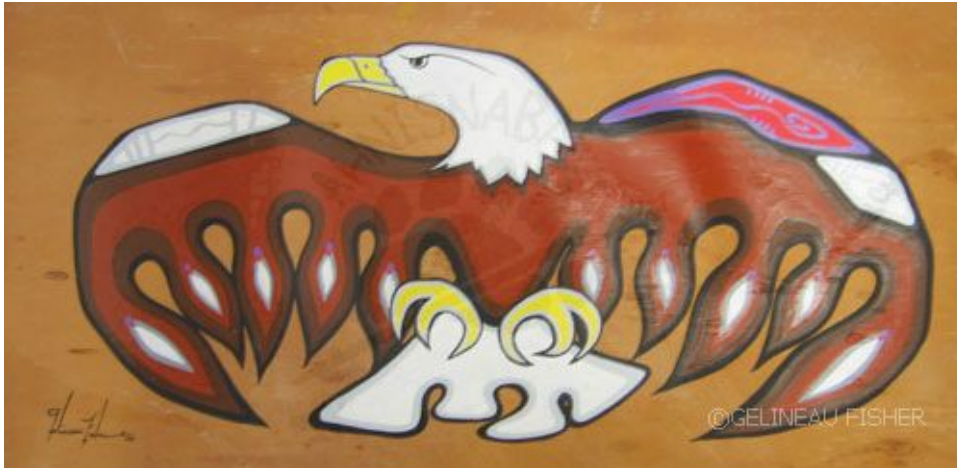
'Eagle' by Gelineau Fisher (Anishinaabe Woodland Art Painter)

trouwingen elkaar aanvullen symboliseert de fysieke en spirituele eenheid van het toekomstige echtpaar.