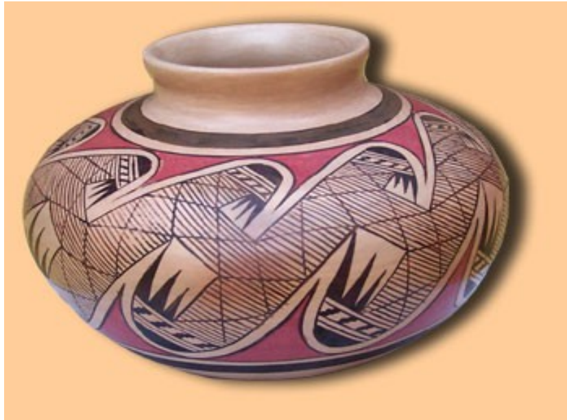
Hopi- vaas voorzien van eeuwenoud migratiedessin