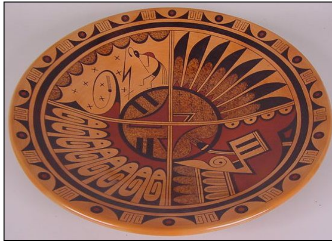
Hopi-schaal, modern design met eeuwenoude symbolen

D e stenen die zowel op de herenring als de damesring in het midden van de vier windrichtingsymbolen geplaatst zijn (respectievelijk turkoois, kleur van de lucht, en bloedkoraal, kleur van de aarde) vertegenwoordigen widigendiwin , oftewel het huwelijk.