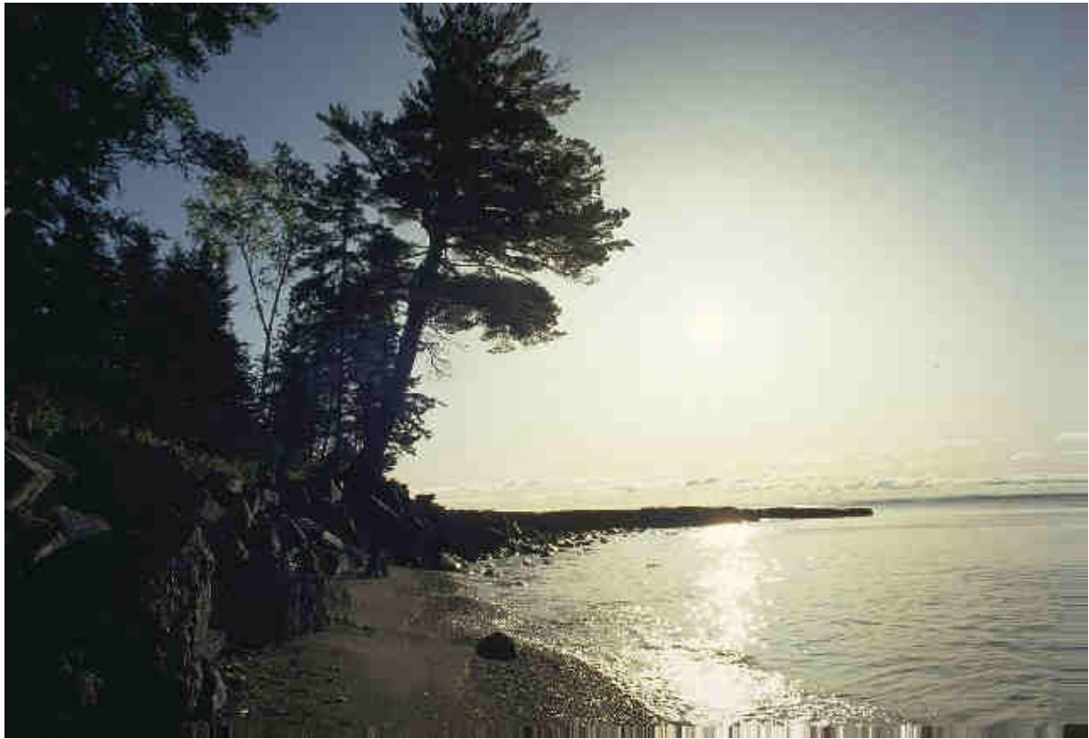
Photo: Lake Superior

Aan de achterzijden van de trouwringen zijn de gestileerde, met roodgoud ingelegde afbeeldingen van twee 'loons' oftewel Canadese ijsduikers geplaatst. De Anishinaabeg, die van oudsher dol zijn op deze eigenwijze watervogel met zijn parelmoeren verenkleed, beschouwen de loon als symbool van huwelijkstrouw. En wie goed luistert hoort bij het vallen van de avond hun melancholiek stemmende kreet galmen over het wateroppervlak van Gichi-Ojibwe-Gamiing , het grote Bovenmeer...