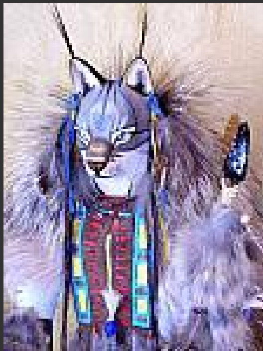
Lynx Manitou Sculpture van Kevin Gadowski