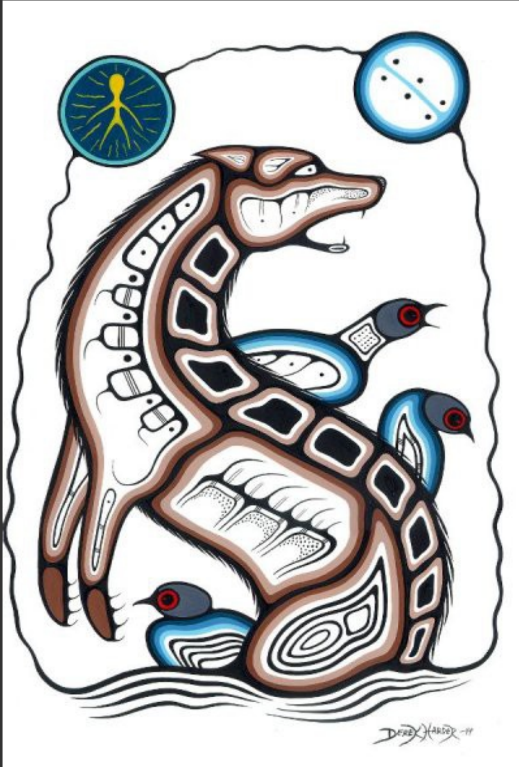
Wolf, grafische prent van Derek Harper (Ojibwe Medicine Painter)