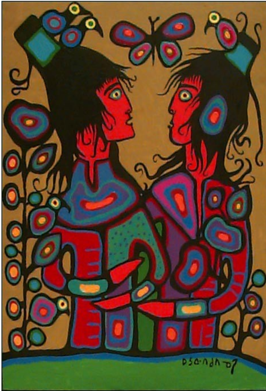
Norval Morrisseau/ Miskwaabik Animikii