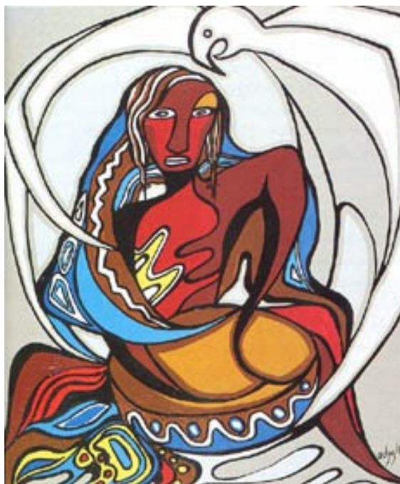
Schilderij van Odaawaa kunstenaar Daphne Odjig

De Midewiganaan , die sinds mensenheugenis gebruikt worden om de geheime ceremoniën van de Midewiwin , het Grote Ethische en Medicinale Genootschap, uit te voeren, hebben dezelfde vorm als het ceremoniële openluchthuis dat Nanaboozhoo , de legendarische weldoener en boodschapper van het Grote Mysterie, lang geleden neerzette in een afgelegen bergdal. Hij deed dit uit dankbaarheid voor een visioen dat hij had ontvangen, en voor het krachtige medicijn dat door het visioen geopenbaard was. Hierdoor was Nanaboozhoo in staat ziektes en kwalen waaronder de mensen leden, te behandelen.