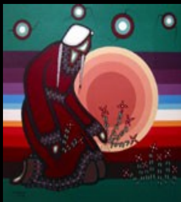
Leland Bell: 'Woman Healer'

De Midewiganaan , die sinds mensenheugenis gebruikt worden om de geheime ceremoniën van de Midewiwin , het Grote Ethische en Medicinale Genootschap, uit te voeren, hebben dezelfde vorm als het ceremoniële openluchthuis dat Nanaboozhoo , de legendarische weldoener en boodschapper van het Grote Mysterie, lang geleden neerzette in een afgelegen bergdal. Hij deed dit uit dankbaarheid voor een visioen dat hij had ontvangen, en voor het krachtige medicijn dat door het visioen geopenbaard was. Hierdoor was Nanaboozhoo in staat ziektes en kwalen waaronder de mensen leden, te behandelen.