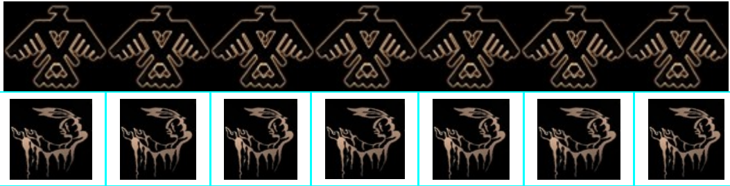
Zevenluik ' honoring the thunder-grandfathers and praying for strong medicine'