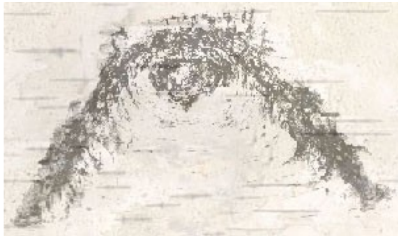
Sacred white birch bark showing Thunderbird design