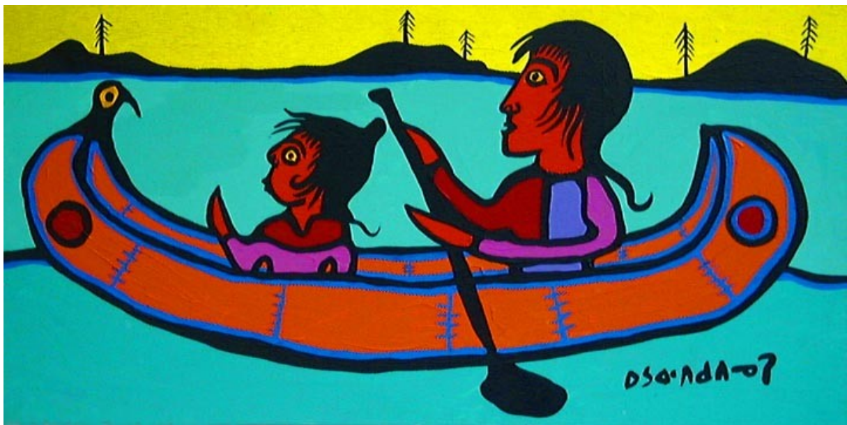
Norval Morrisseau: 'Herb Picking With Grandfather'