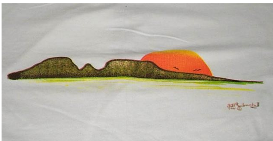
Sleeping Giant, Thunder bay, illustratie door Bill Guiboche, Métis artiest

Maar in de meest specifieke zin verwijst de symboliek in deze trouwringen naar het Anishinaabe -concept van wiidigendiwin - de sterkste verbintenis die mogelijk is tussen twee geliefden (het huwelijk).