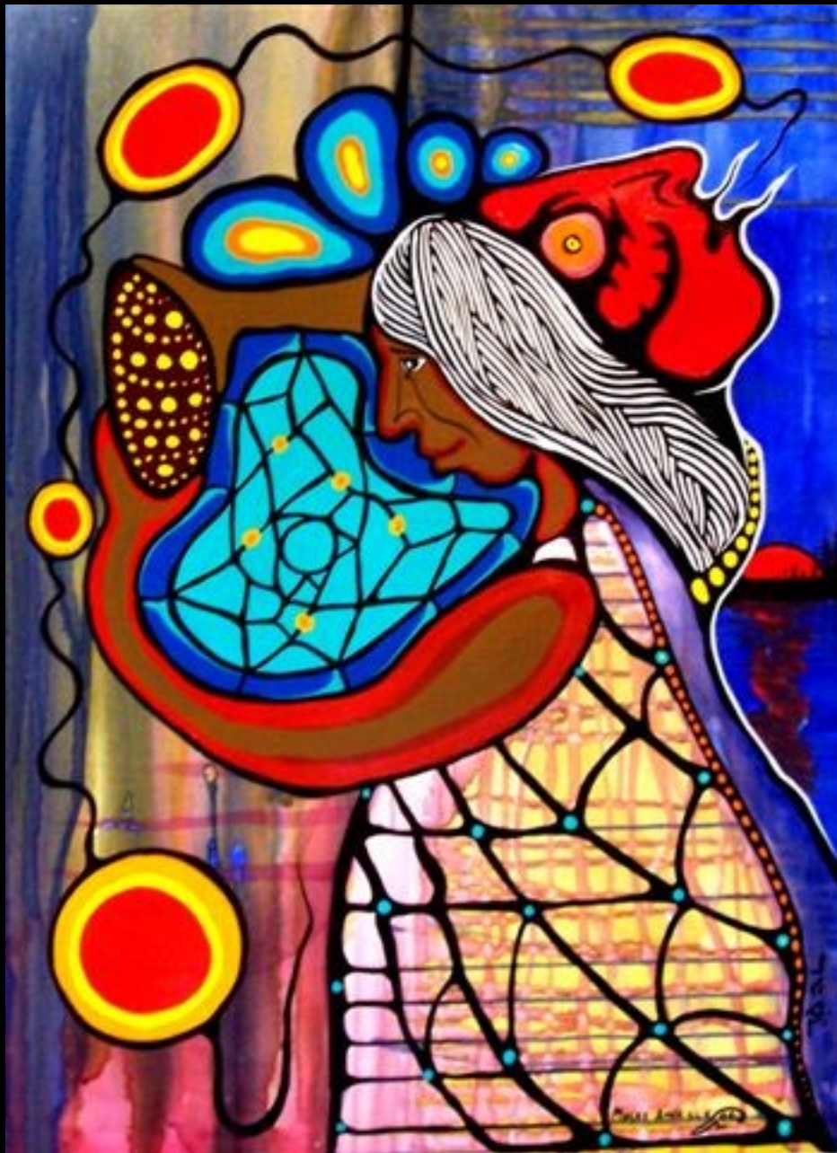
"Dream Catcher" schilderij van Ojibwe Medicine (Woodland) Painter Moses 'Amik' Beaver