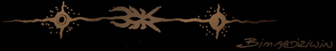
"Bimaadiziwin" (Leven), illustratie door Zhaawano Giizhik