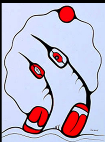
M.A. Jacobson: 'Life Partners'

De binnenzijden van deze 'levensweg'-trouwringen, tenslotte, 'verbergen' de gestileerde afbeelding van een Canadese loon. De keuze voor deze watervogel heeft de trouwringensmid zeker niet bij toeval gemaakt. De loon of ijsduiker – die de Anishinaabeg maang noemen – is namelijk in de traditionele belevingswereld van dit volk het ultieme symbool van huwelijkstrouw. Een ijsduikerspaartje staat erom bekend nooit van elkaars zijde te wijken!