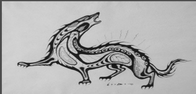
Drawing by Anishinaabe Medicine Painter Carl Ray