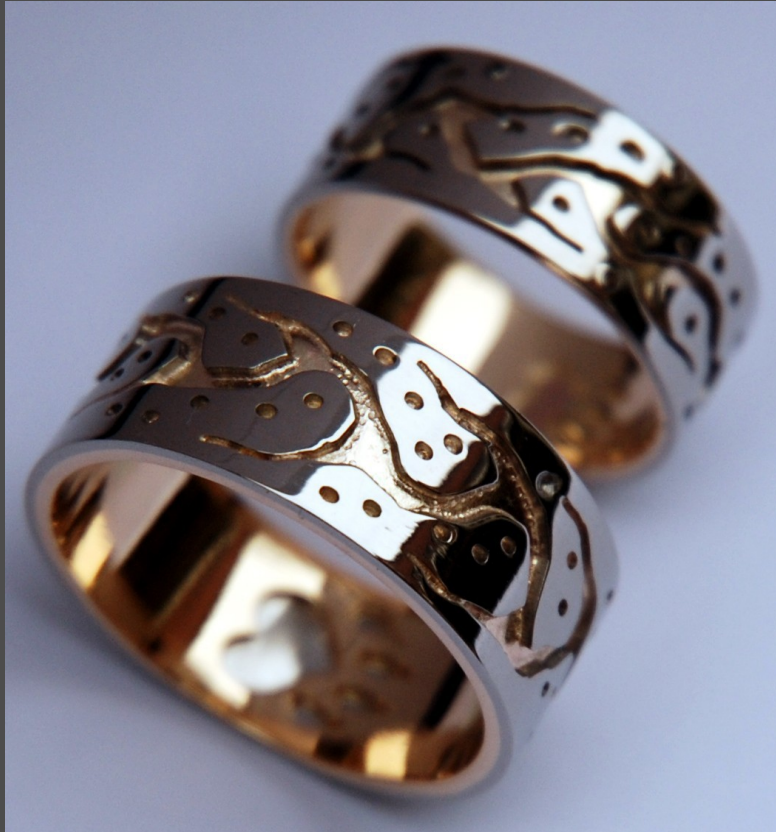
Trouwringen 'bimosewin maamawi' uitgevoerd in 14 kt. palladiumwitgoud en 14 kt. warmgeelgoud. Palladiumwitgoud heeft een grijzere kleur dan gewoon witgoud.

Mysterie, de geest van Ma'iiñgan (Wolf) afdalen naar de wereld van de mensen om hen te leren dat ze volhardend moeten zijn en hun naasten moeten beschermen; tevens droeg hij hem op Manaboozhoo, de speciale gezant van Gichi-Manidoo, te helpen bij de creatie van de aarde. Nadat deze belangrijke opdracht er opzāt en de eerste planten, dieren en mensen op de wereld waren geplaatst beval Gichi-Manidoo Nanaboozhoo en zijn broeder Ma'iiñgan – die zich intussen als een wijs en eerbiedwaardig leraar had ontwikkeld – ieder hun eigen weg te gaan. En nog altijd eren de Anishinaabeg Ma'iiñgan, de wolf wegens zijn speciale rol in de creatie van de wereld.