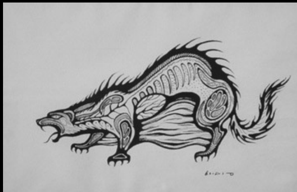
Carl Ray: 'Lynx'