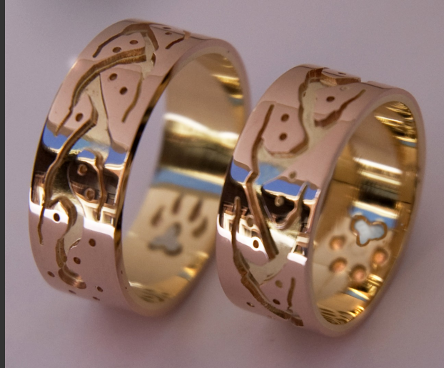
Trouwringen: The Way of the Warrior © Unieke Trouwringen