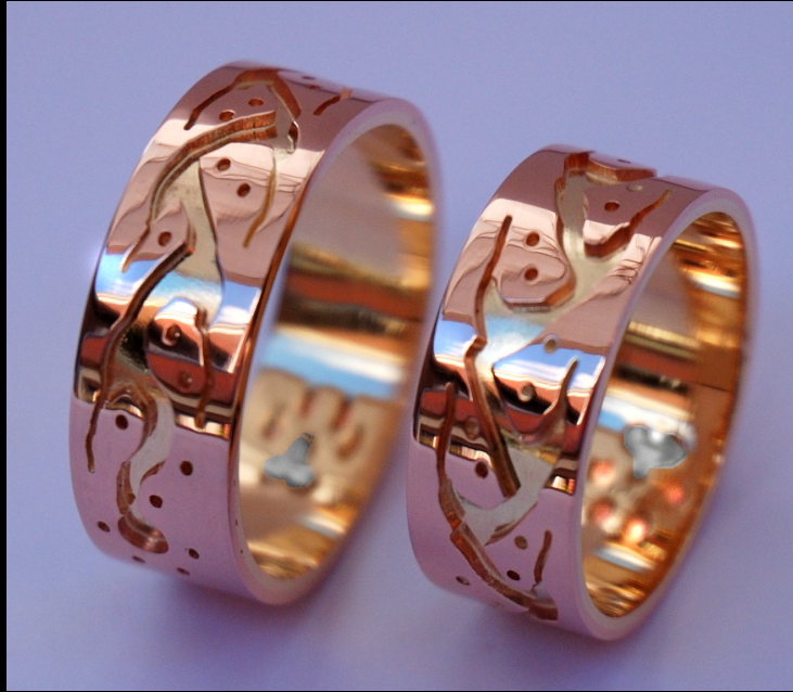
Trouwringen: The Way of the Warrior

Ma'iingan de wolf en Biziw de lynx vertegenwoordigen, samen met Makwa de beer, het krijgerstotem. Alle drie zijn totemische symbolen van defensie ; alle drie staan ze bekend als de sterkste beschermgeest die een krijger zich kan wensen. Ma'iingan , de onverschrokken krijger met zijn grijze vacht staat voor doorzettingsvermogen en bescherming; Biziw , de zilverkleurige, solitaire besluiper, toont de mensen zielskracht en vastberadenheid. Zij die via geboorte tot een van deze doodemag (totemclans) behoren, worden geacht de waarden en karaktereigenschappen van deze formidabele jagers na te streven en er op een bewuste manier naar te leven; hun levensloop wordt er zelfs diepgaand door beïnvloed!