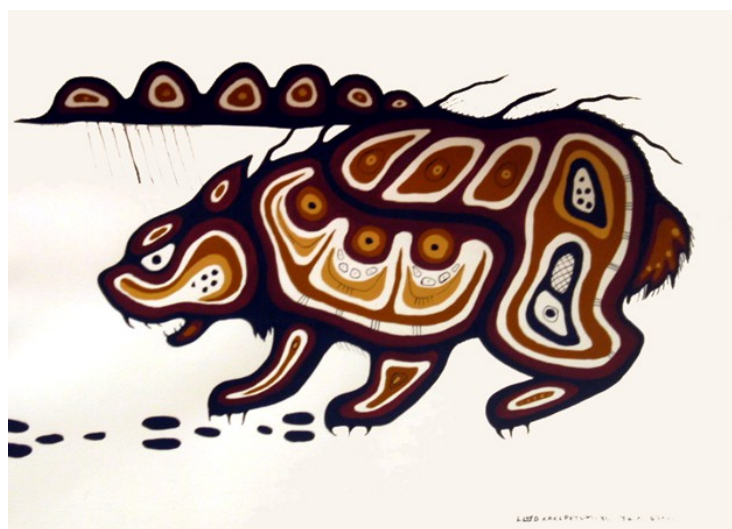
Lloud Kakepetum: "The Hunter"

Deze legendarische gebeurtenis ligt aan de basis van de sociale structuur en regeringssystemen zoals die tot op de dag van vandaag bestaan. Men koos bewust de awesi'ag (dieren) uit om deze principes te vertegenwoordigen, omdat dieren in harmonie leven met de wetten van de natuur en zich aldus oudere, wijze broeders tonen die de mensen veel kunnen leren.