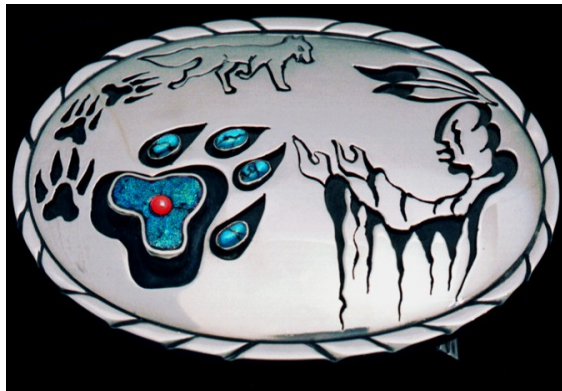
Silver 'medicine wolf' belt buckle by Zhaawano

Tot slot heeft de edelsmid/kunstenaar een symbool verwerkt - verstopt in het palladiumwitgouden interieur van beide trouwringen - van een uiterst persoonlijk karakter, dat dan ook niet zichtbaar gemaakt is op de afbeelding. Het teken weerspiegelt - wat Zhaawano's voorouders noemden - de ojiichaagoma van de ringdrager: de geest en de ziel van een persoon, oftewel de essentie van zijn levenskracht.