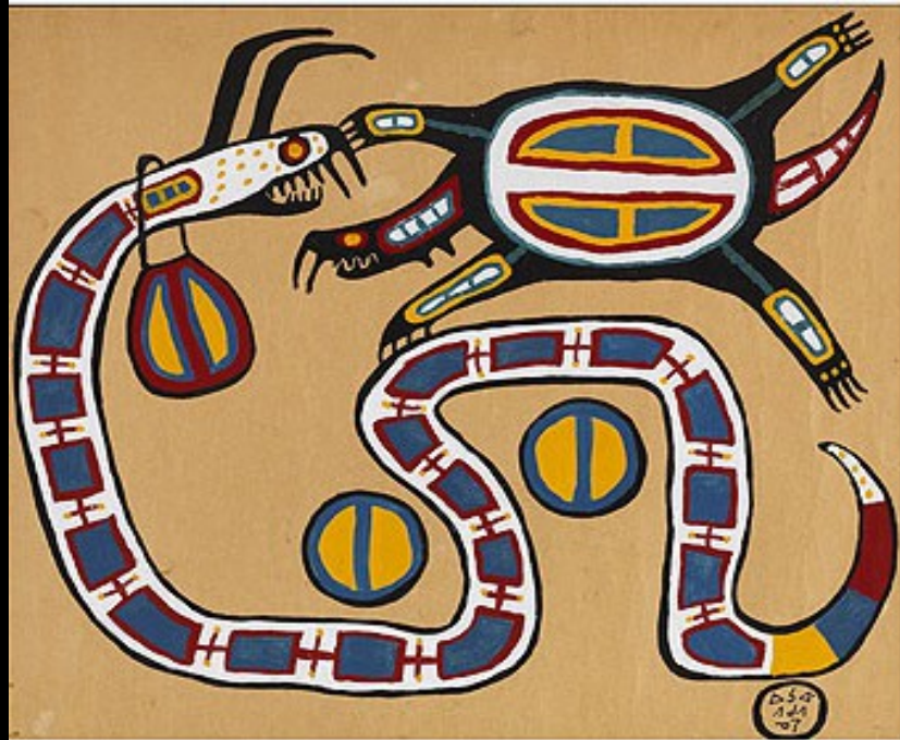
Norval Morrisseau (Miskwabik Animkii): The Snake And The Turtle