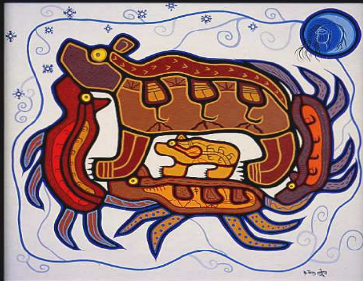
Roy Thomas: Spirit of the North wind