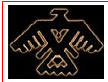
Traditional Ojibwe thunderbird design

Over een juiste prijs van een trouwringmodel kunt u zich desgewenst telefonisch, per fax, per e-mail of d.m.v. het contactformulier altijd nader laten informeren.