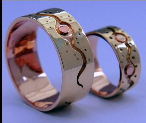
“Een Rivier Stroomt Door Ons Hart”