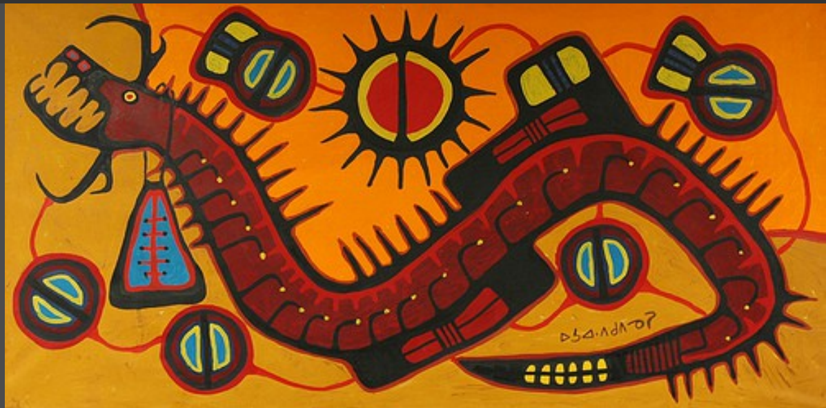
Norval Mornisseau/ Miskwaabik Animikii: title unknown

N.B. Het in deze trouwringen gebruikte geelgoud heeft een warmere kleur dan gewoon 14 karaats geelgoud. Het gebruikte witgoud is een legering van puur goud en palladium, een exclusief, grijswit platinametaal.