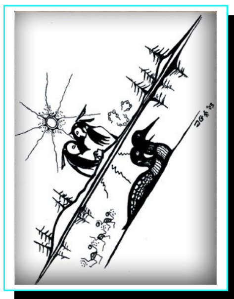
"Partners", drawing by Zhaawano Giizhik

Over een juiste prijs van een trouwringmodel kunt u zich desgewenst telefonisch, per fax, per e-mail of d.m.v. het contactformulier altijd nader laten informeren.