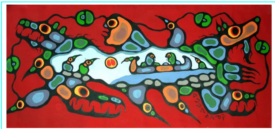
Painting by Ojibwe Medicine Painter Norval Morrisseau, showing the interconnectedness of all life forms

Zeven of negen "energie" spikkels omlijsten iedere op de ringscheen afgebeelde spirit sun en zijn een teken van de alomtegenwoordigheid van Gichi Manidoo (Groot Mysterie). Het ontwerp van de trouwringen, doordat het concentraties of samenballingen van spirituele energie symboliseert - en daarmee de levenskracht die overal op de aarde maar ook erbuiten aanwezig is, alsmede de relatie tussen een persoon of wezen met het universum en met alle andere wezens, stoffelijk of onstoffelijk – roept associaties op met de heilige kunst van Zhaawano's indiaanse voorouders.