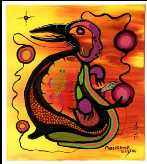
Moses Amik: Spirit Quest