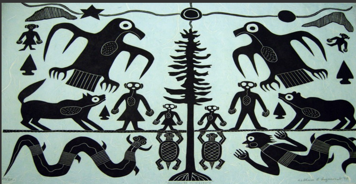
Zeefdruk van Ojibwe kunstenaar Ahmoo Angeconeb: "Anishnawbe Miinigowin". De kosmos volgens de noordelijke Anishinaabeg bestaande uit meerdere lagen en beheerd door dualistische krachten. In plaats van een cederconifeer heeft de kunstenaar een struikden afgebeeld als symbool van de 'axis mundi'.