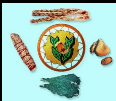
De vier heilige planten volgens het medicijnwiel

De Midewiwin , het eeuwenoude Grote Medicijnhuis van de Anishinaabeg, associeert zowel zhaawano giizhig (de zuidelijke lucht) en zhaawondazii (de zuidenwind) als giizhik (de witte cederconifeer) met de kleur blauw! Blauw staat voor bescherming in het traditionele Anishinaabe-wereldbeeld.