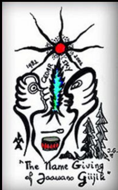
Pentekening: Zhaawano Giizhik © Unieke Trouwringen.nl